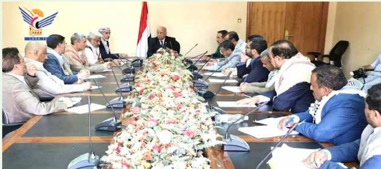
صنعاء - النقل والأشغال:

ناقشت اللجنة التحضيرية للاحتفال بالمولد النبوي الشريف على صاحبه أفضل الصلاة والتسليم في اجتماعها برئاسة رئيس مجلس الوزراء أحمد غالب الرهوي، الإعداد والتحضير للاحتفاء بهذه الذكرى العطرة للعام ١٤٤٧هـ.