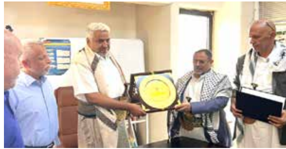
درع الشكر والتقدير لمعالى الوزير، الذي اضطلع به في تحقيق أهداف المؤتمر وإجراح رسالته التضامنية.

كرّمت اللجنة التحضيرية لمؤتمر فلسطين الثالث، وزير النقل والاشغال العامة، اللواء محمد عياش فخيم، بدرع وشهادة المؤتمر، تقديراً وعرفاناً لما بذله من جهود كبيرة في إنجاح فعاليات المؤتمر الداعم لقضية الأمة الإسلامية المركزية، القضية الفلسطينية. ويجرى التكريم خلال فعالية رسمية، سئل فيها رئيس اللجنة التحضيرية للمؤتمر، الدكتور عبدالرحيم الحمران،