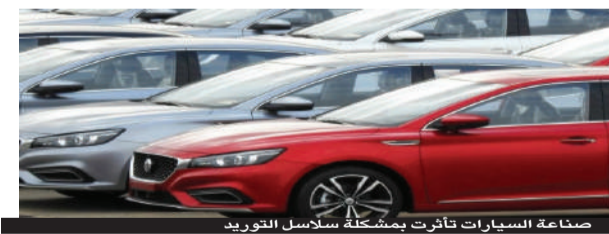
صناعة السيارات تأثرت بمشكلة سلاسل التوريد

وبموجب أمر تنفيذي وقَّعه بايدن، في 25 فبراير 2021، ستتم مراجعة شاملة لسلاسل التوريد للوكالات