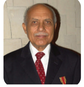
بقلم: أمين درهم