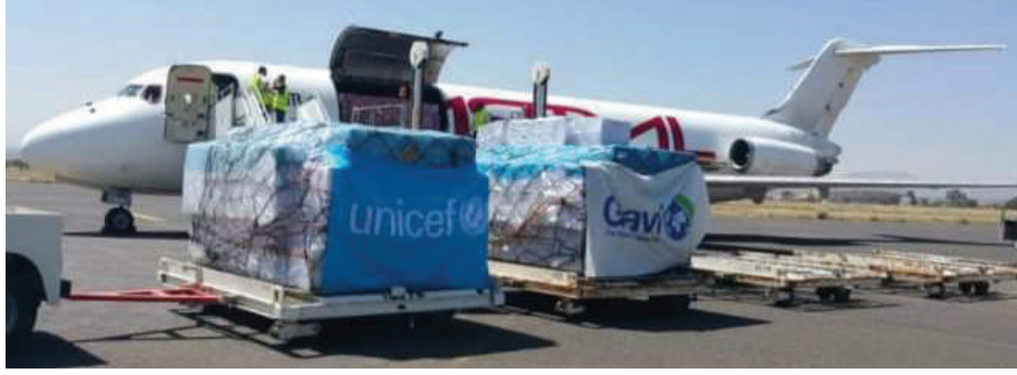
الملاحه الجوية للأمم المتحدة والمنظمات الانسانية الدولية العاملة في اليمن.

ودعا أحرار العالم للخروج في مسيرات بمختلف دول العالم للوقوف إلى مظومية الشعب اليمني وفضح جرائم وانتهاكات دول العدوان بحق المدنيين والبنية التحتية في اليمن.