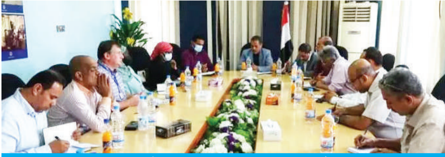
استعراض مشاريع برنامج الأمم المتحدة الإنمائي بميناء الحديدة