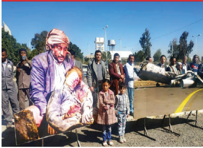
مدير مطار صنعاء الدولي لوكالة يونيوز للأخبار :

وقال: «على دول العدوان رفع الحظر عن مطار صنعاء الدولي للتخفيف عن معاناة الشعب اليمني بدلا عن استهدافه وتدمير بنيته التحتية التي تخدم