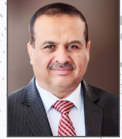
اللواء / عبدالله يحيى الدرة وزير النقل